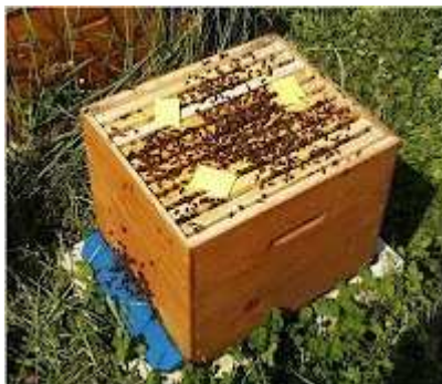
Timol en esponjas

A las abejas el timol no les gusta. Cuando se utiliza, aumenta su agresividad , el pillaje , la deriva y el comportamiento higiénico (sacan mucha cría y baja la población) y pueden llegar a abandonar de forma completa la colmena.