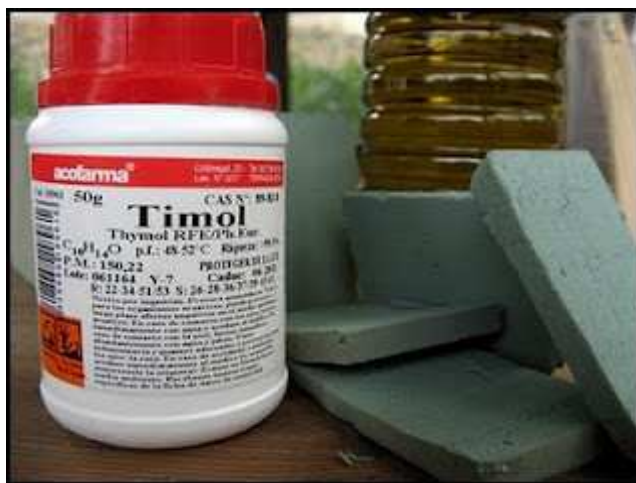
Timol a granel y esponjas de vermiculita

La preparación de tratamientos artesanales no autorizados requiere de una manipulación del timol "en bruto" no exenta de riesgos. El timol tampoco es inocuo para el apicultor: hay que tener cuidado al manejarlo pues es corrosivo y cáustico por contacto con la piel , pudiendo causar daños irreversibles en los ojos; es irritante por inhalación , debiendo evitarse inhalar sus vapores y puede causar problemas de alergia; también es tóxico por ingestión .