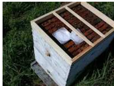
Timol en gel